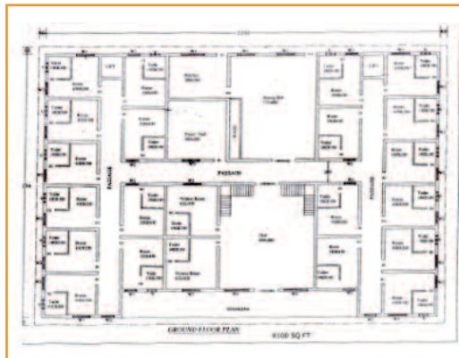
Progetto nuova costruzione