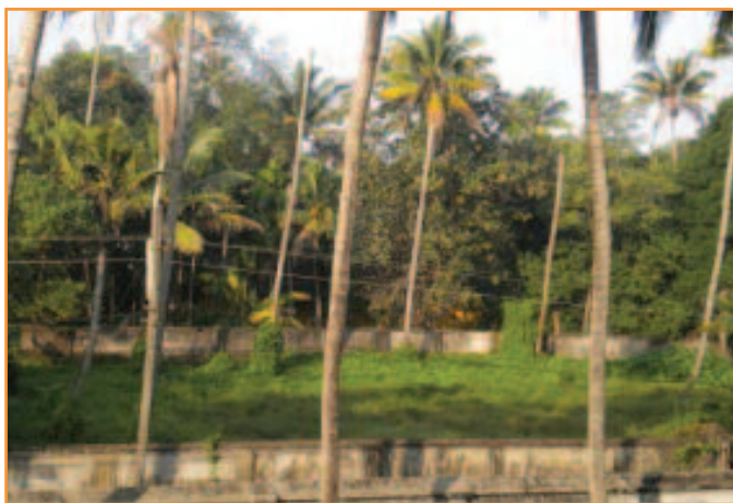
Terreno dove sorgerà la nuova costruzione