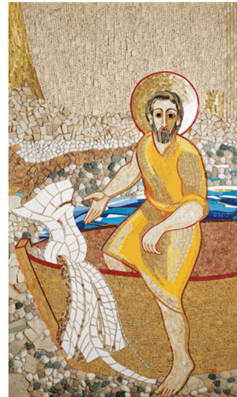
La chiamata di Simon Pietro

Casa Generalizia – Roma Istituto Figlie del Divino Zelo